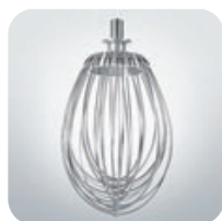
Frusta fili fini