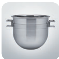
Vasca / Bowl