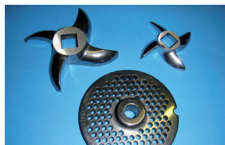
Piastre Coltelli autoaffilanti**

**EMULA dispone di tutti i pezzi di ricambio oltre che l'assistenza.